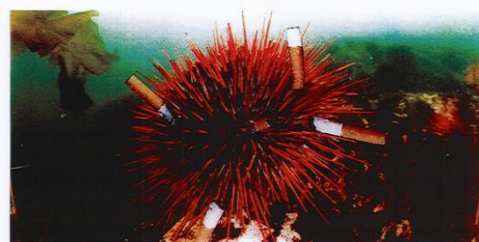
LA MER PIQUE TOUT

Des ambassadeurs du tri de la ville de La Garde ont effectués des sensibilisations auprès des scolaires. Des affiches, produites par le conseil de ville des enfants, ont également été diffusées afin de sensibiliser les usagers des plages aux impacts des mégots sur l'environnement. Ces deux actions ont permis de sensibiliser plus de 1000 enfants.