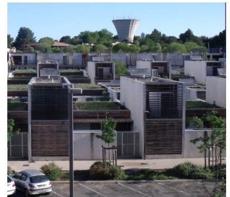
Toitures végétalisées – Quartier Maille II

Réalisation de toitures végétalisées conçues avec des préconisations relatives à la couche de substrat et au choix d'espèces adaptées au climat méditerranéen.