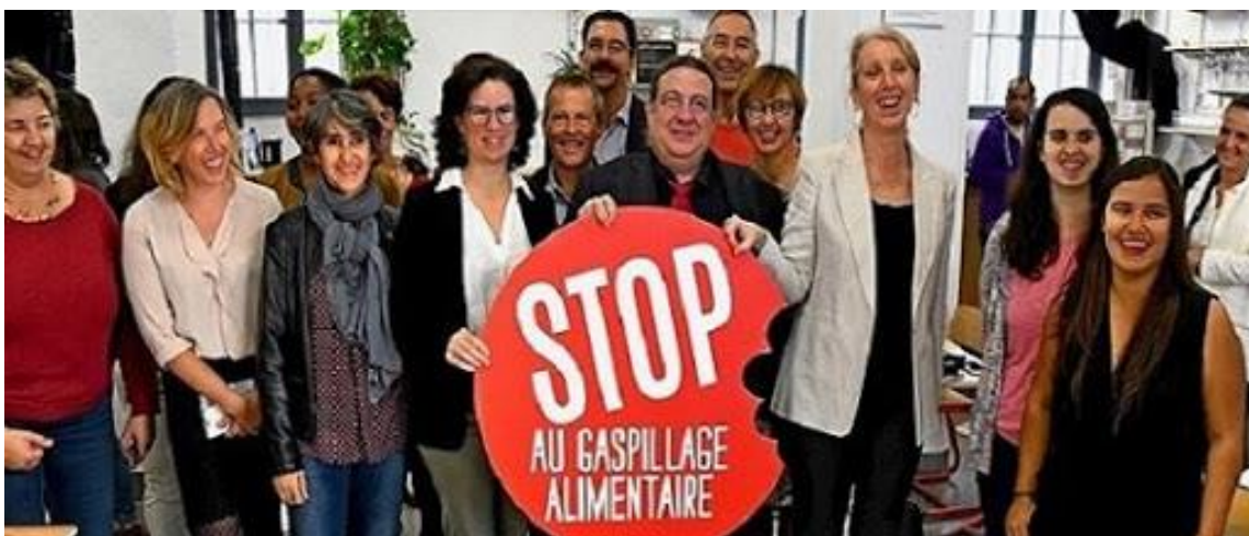
Lancement du réseau le 16 octobre 2019