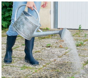
Le désherbage à l'eau bouillante : sûr et efficace