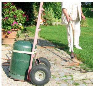
Désherbage au gaz