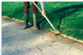
Binage des bordures d'allées