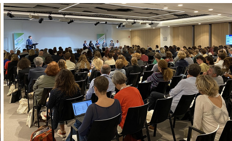
TABLE-RONDE « Collectivités, associations, entreprises, gestionnaires : la prise en compte de la biodiversité et de l'eau par les acteurs »