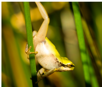
Rainette verte

Les ARB contribuent au développement et à la diffusion des connaissances en matière de biodiversité, avec par exemple, l'élaboration d'une stratégie régionale de la connaissance. Elles peuvent également animer un Observatoire régional de la biodiversité , soutenir la réalisation d' Atlas de la biodiversité communale (ABC), participer à la collecte et la structuration des données, ou au déploiement des sciences participatives .