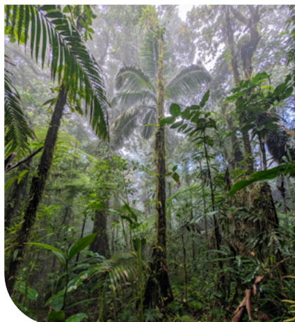
Forêt dense humide à Deshaies - Guadeloupe