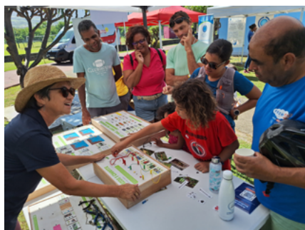
Biodiversité et mobilité douce

La sensibilisation et l'éducation à l'environnement sont des axes forts de l'action des ARB. Elles participent au déploiement d' aires éducatives ou encore à la formation et la sensibilisation des élus , à l'organisation de conférences, d' événements (Rencontres biodiversité, webinaires, formations naturalistes, Gayar Pik Nik ) ou de visites professionnelles inspirantes (Biodiv'tour), à la création d' outils et à la publication de supports (NaturoScoop, expositions).