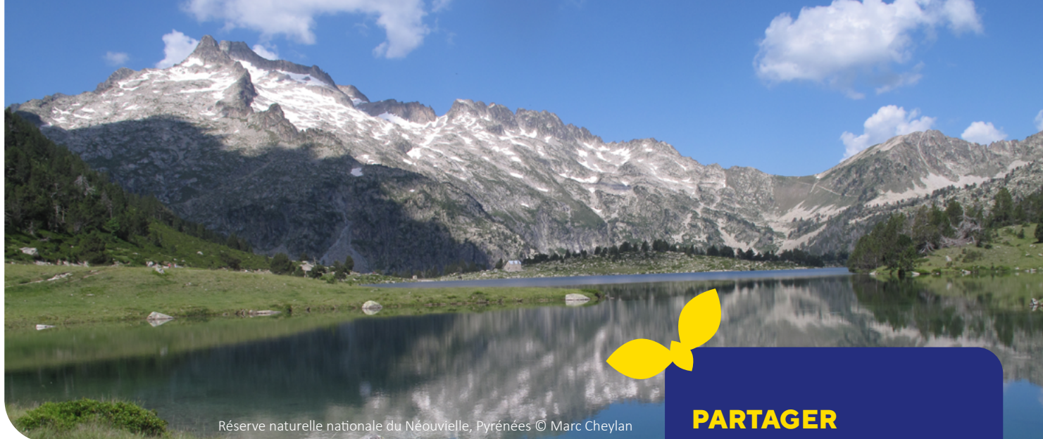
Réserve naturelle nationale du Néouvielle, Pyrénées

des dispositifs régionaux mais aussi nationaux, par exemple, les programmes Territoires engagés pour la nature , Entreprises engagées pour la nature , et Capitale française de la biodiversité . Elles assurent également une veille sur les financements existants, orientent les porteurs de projets pour l'accès aux financements ou encore l'animation de réseaux régionaux des gestionnaires d'espaces naturels.