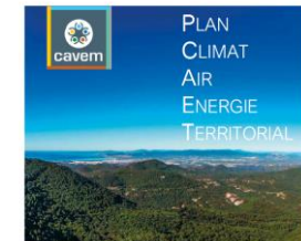
Document 2 : Stratégie territoriale