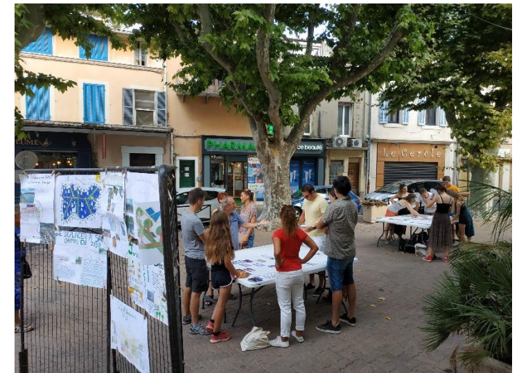
Fresque du Climat Exposition des collégiens