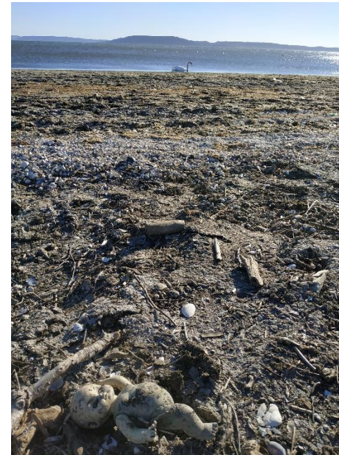
Déchets dans la nature