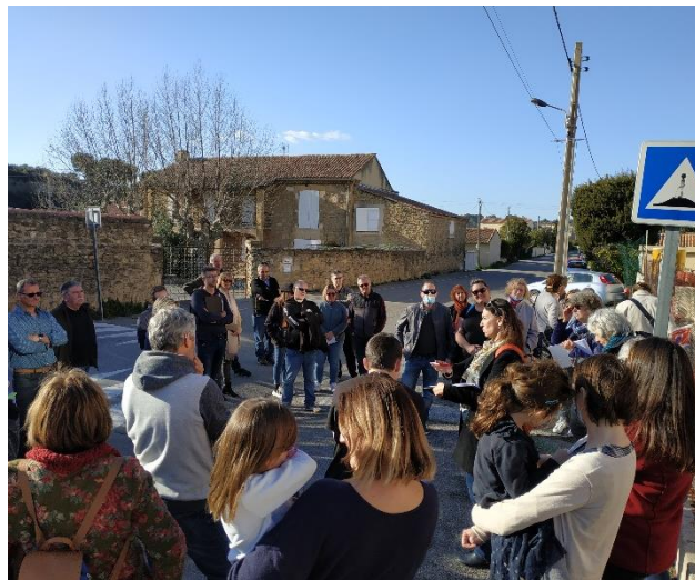
Atelier citoyen route du loir