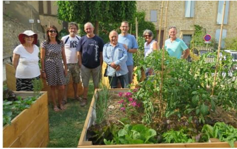
Création de jardins et composteurs collectifs