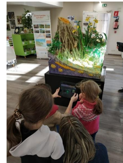
Animation à la médiathèque