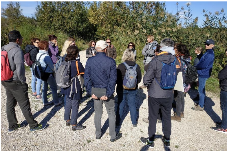
Balade naturaliste pour les enseignants