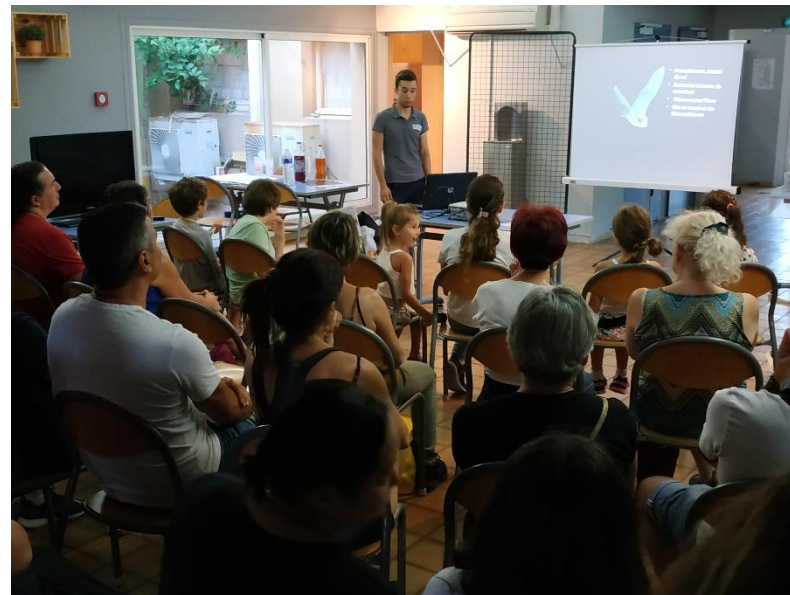
Nuit de la Chauve-souris