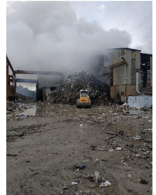
Incendie d'un centre de déchets