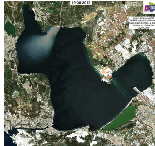
Crise de l'étang de Berre