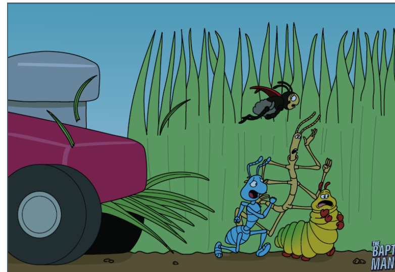
Illustration de Baptiste Drausin