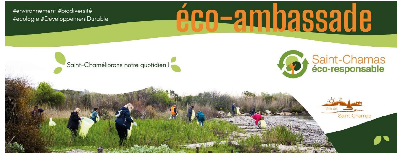
Page des éco-ambassadeurs de la ville