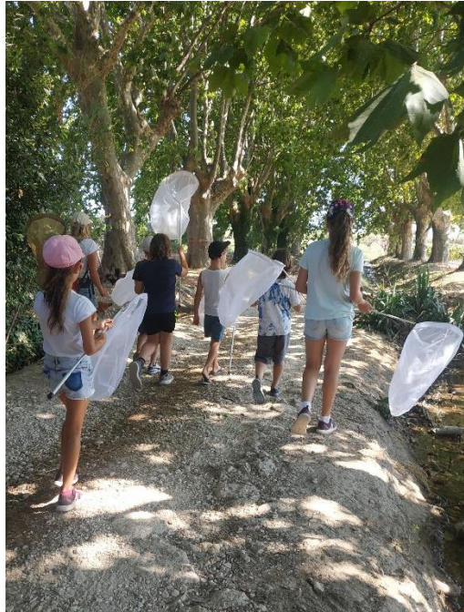
Devine qui papillonne...

un partenariat avec LPO PACA et CENPACA sur la base de sciences participatives