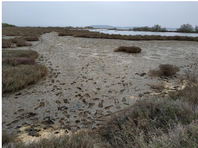
Surfréquentation des espaces naturels