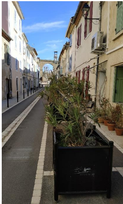
Rue Victor Ferrier

à destination des habitants et des commerces