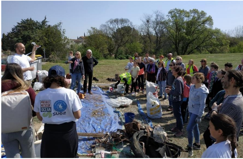
Ramassage citoyen de déchets