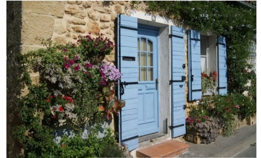
Rue Marcel Bœuf