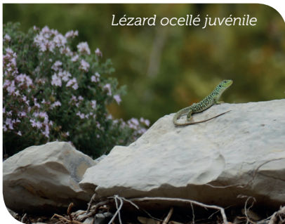
Lézard ocellé juvénile

L'espèce a fait l'objet d'un plan interrégional d'action Provence-Alpes-Côte d'Azur /Languedoc Roussillon 2013-2017 afin de définir et de mettre en œuvre des actions coordonnées, à court, moyen et long terme, pour la conservation du Lézard ocellé et de ses habitats en Provence-Alpes-Côte d'Azur et en Languedoc-Roussillon.