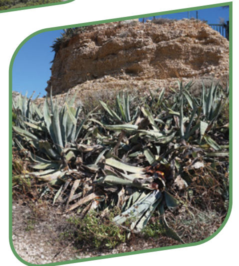
Espèces végétales exotiques envahissantes