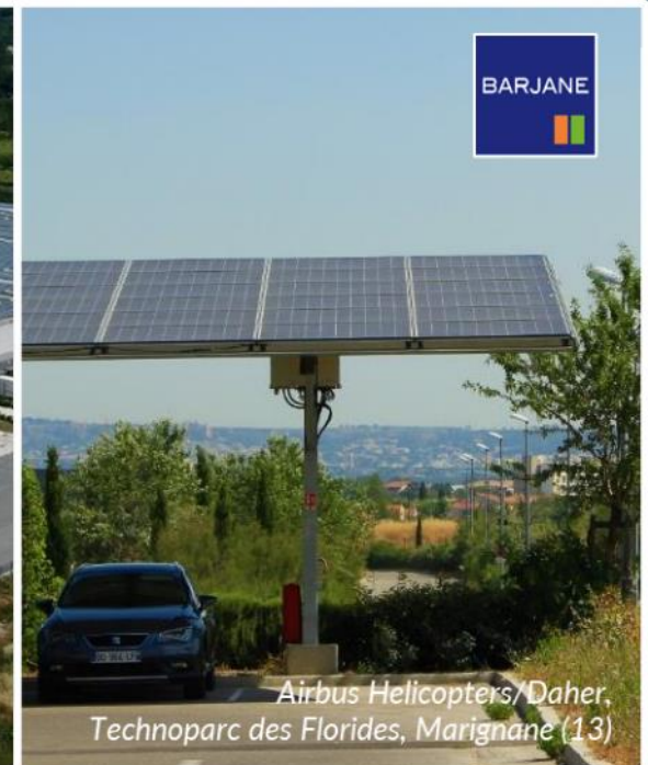
Airbus Helicopters/Daher, Technoparc des Florides, Marignane (13)