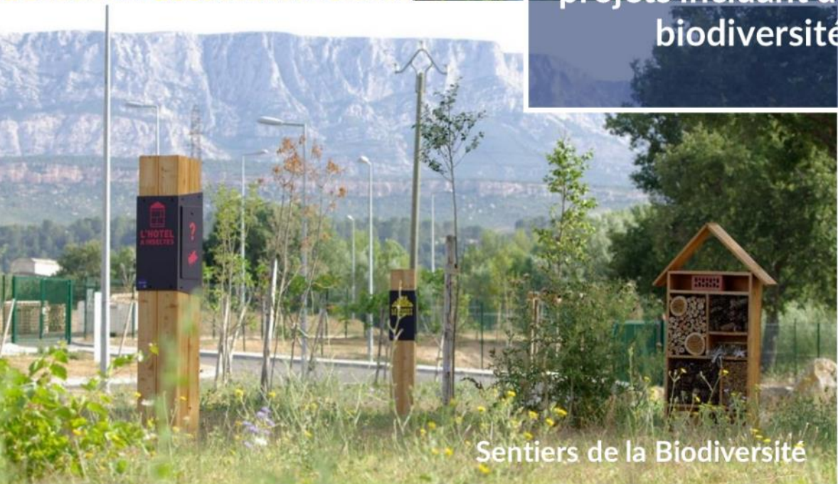
Sentiers de la Biodiversité

Objectif 2 : 100% des nouveaux projets incluant des actions pour la biodiversité d'ici 2025.