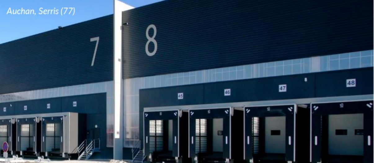
Bandeaux filants en façade pour un apport de naturel de lumière