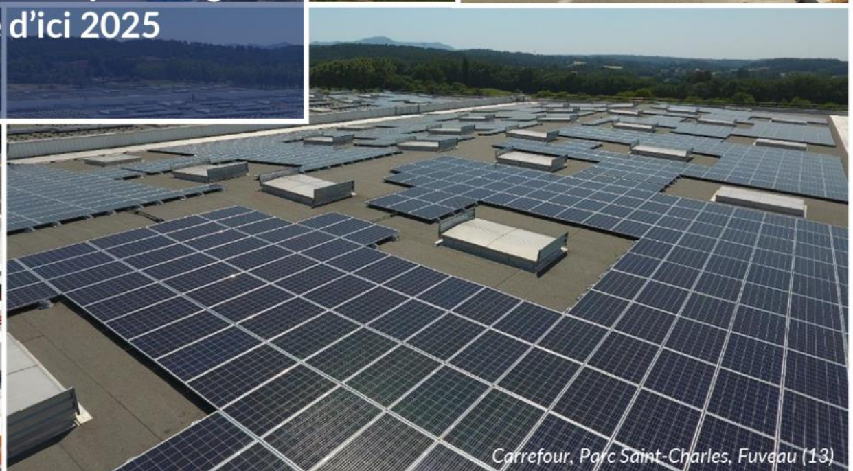
Carrefour, Parc Saint-Charles, Fuveau (13)