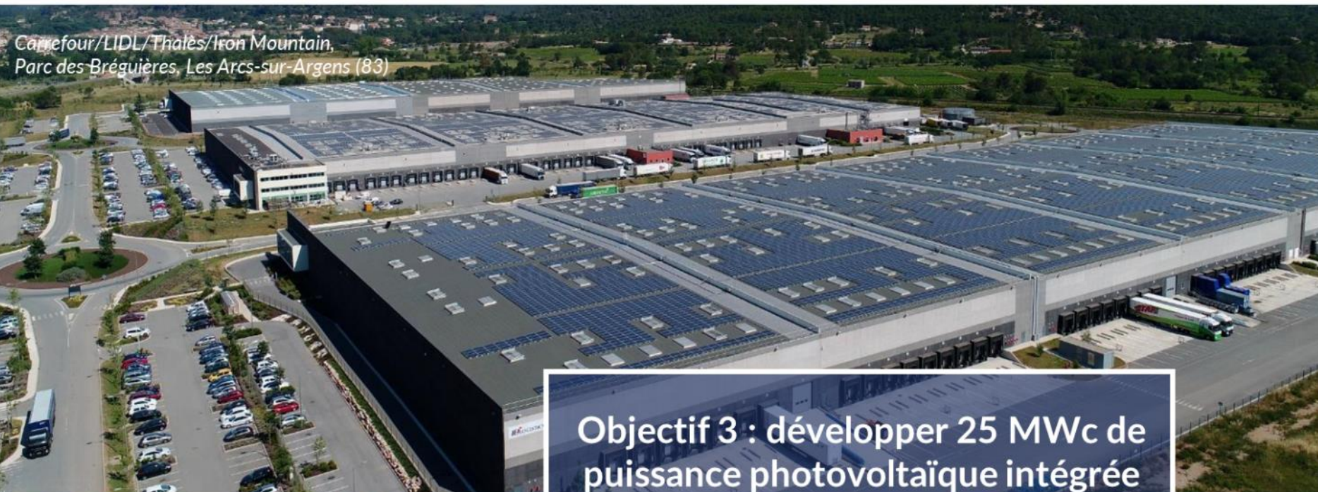
Carrefour/LIDL/Thalès/Iron Mountain, Parc des Bréguières, Les Arcs-sur-Argens (83)

Objectif 3 : développer 25 MWc de puissance photovoltaïque intégrée en toiture d'ici 2025