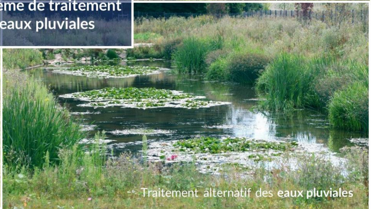
Traitement alternatif des eaux pluviales