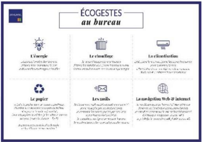
Actions de sensibilisation en interne et auprès des usagers des sites