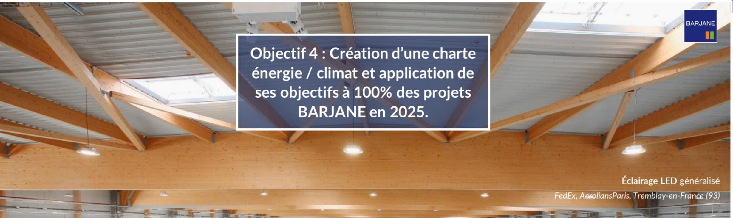
Éclairage LED généralisé

FedEx, AéroliansParis, Tremblay-en-France (93)