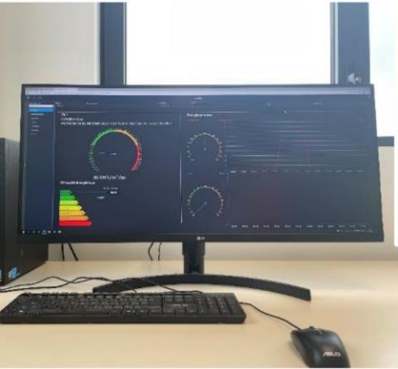
Pilotage et monitoring des consommations via une GTB et sous-comptage des consommations

FedEx, AéroliansParis, Tremblay-en-France (93)