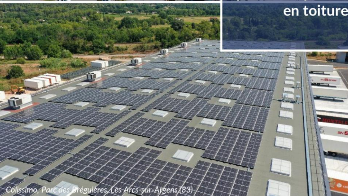
Colissimo, Parc des Bréguières, Les Arcs-sur-Argens (83)