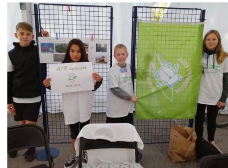
ATE à Sospel