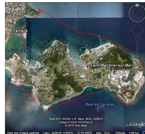
AME à Saint Mandrier