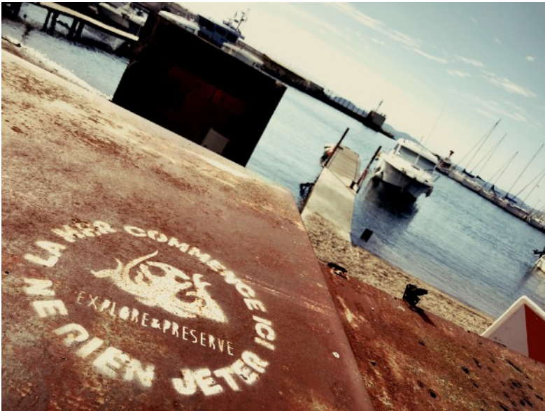
Séries de panneaux en bois Pochoirs Cendriers de poche