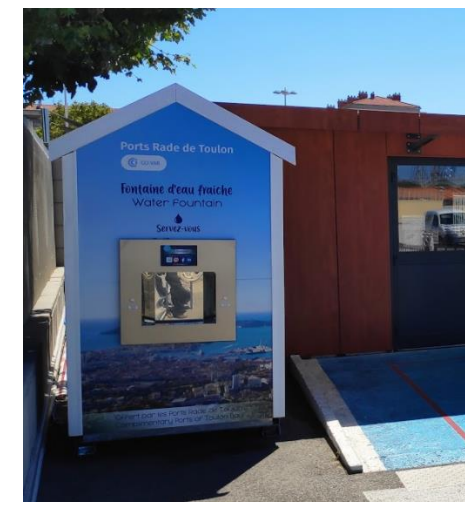
Rade de Toulon