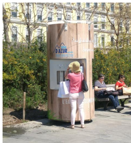
4 fontaines à Nice