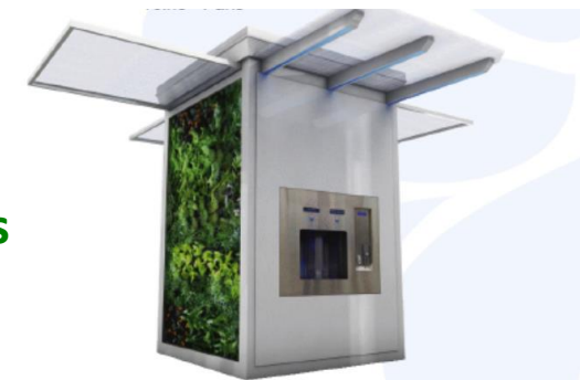
"Fontaineo La Parisienne solaire " végétalisée à panneaux rétractables

Un mini-écran (jusqu'à 10 pouces) pour communiquer des messages dynamiques liés à l'impact environnemental de nos fontaines (nombre de bouteilles en plastique évitées etc.).