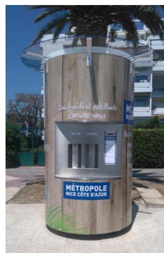
St Laurent du Var