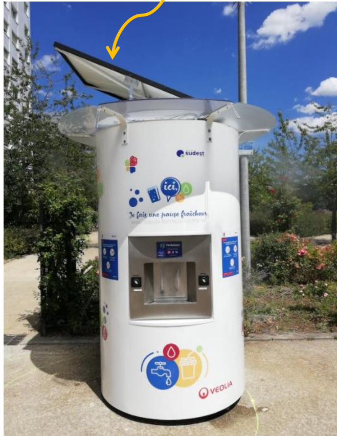
Bonneuil sur Marne (94)

... La végétalisation de nos fontaines : contribution à l'assainissement de l'air grâce à la production d'oxygène et à la diminution du taux de CO2 par photosynthèse.