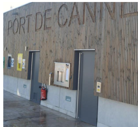
Port de Cannes