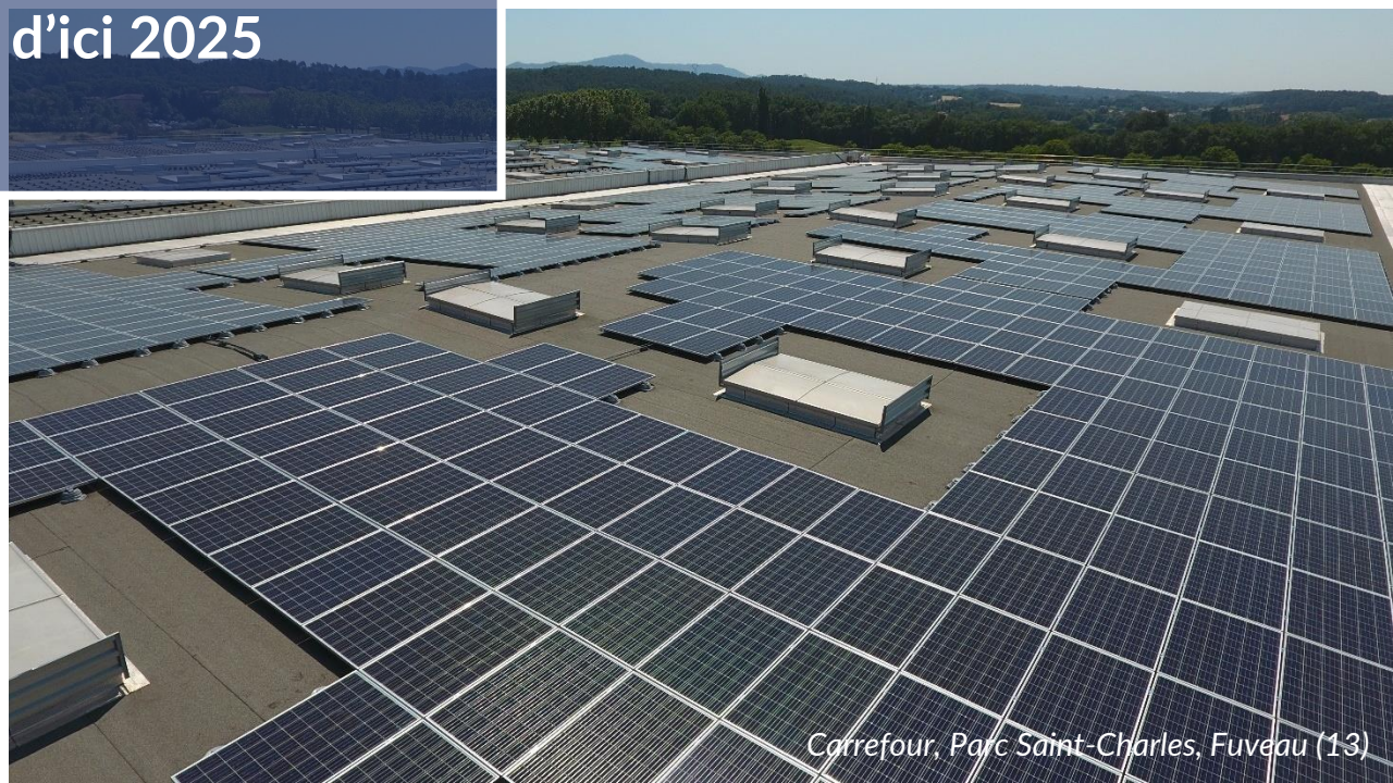
Carrefour, Parc Saint-Charles, Fuveau (13)