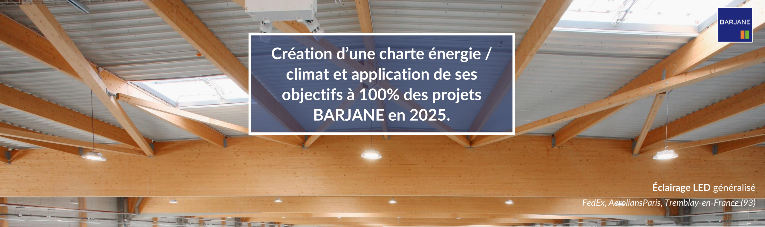
Éclairage LED généralisé