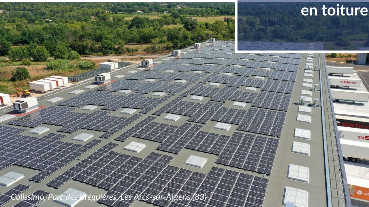
Colissimo, Parc des Bréguières, Les Arcs-sur-Argens (83)