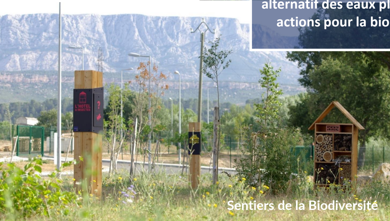
Sentiers de la Biodiversité