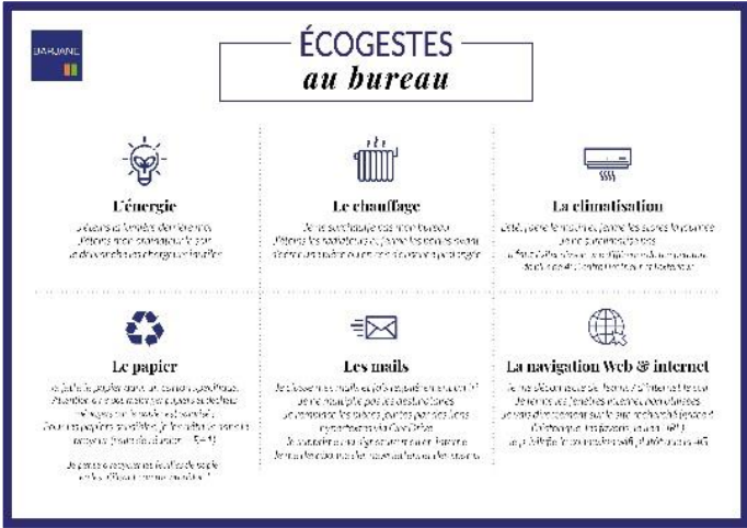
Actions de sensibilisation en interne et auprès des usagers des sites