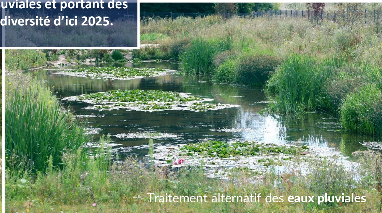
Traitement alternatif des eaux pluviales